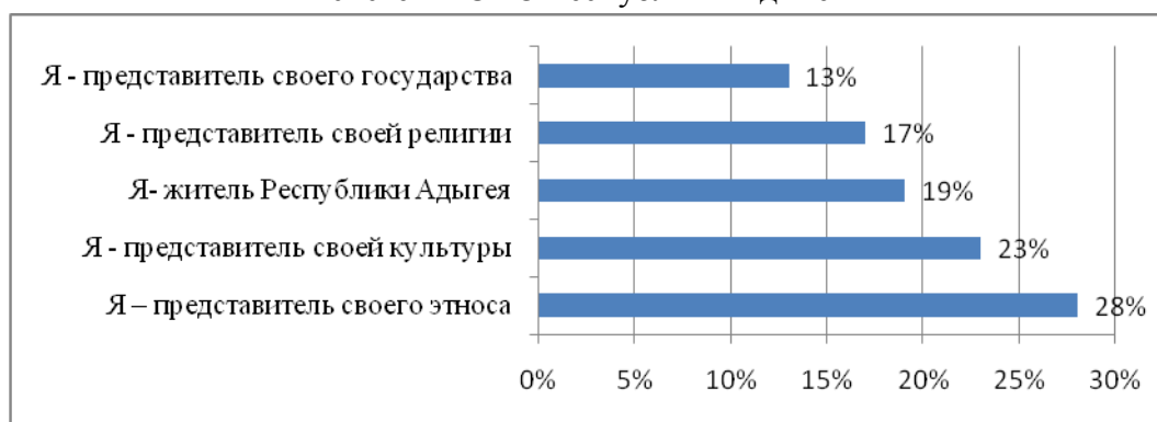
Диаграмма 1 – Показатели идентификационных приоритетов обучающейся молодежи системы СПО Республики Адыгея

Соседствующее положение гражданской солидарности с религиозными компонентами в идентификационной матрице молодежи региона усиливает утверждение об инвариантности первой. Трансформация религиозных ценностей некоторых народов Северного Кавказа и адыгов в частности, происходила путем внешнего вмешательства. Процесс вакцинирования исламской религиозной культуры, являющийся официальной для адыгов, на сегодня не привел к окончательной сформированности мусульманского самосознания. Синкретизация в Адыгее ислама с этногенетическими верованиями