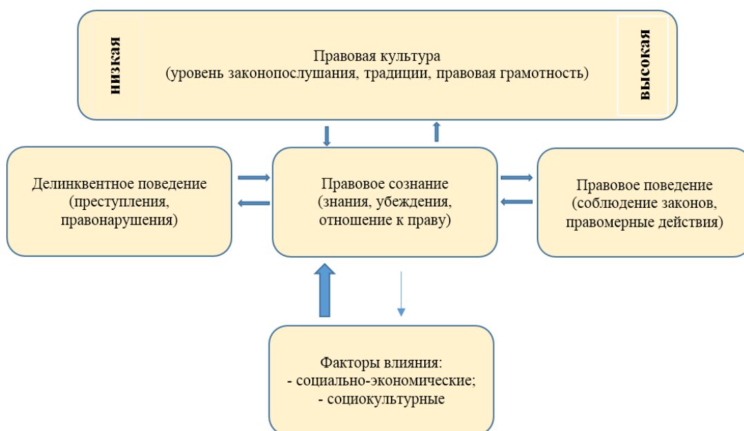
Схема 1. Взаимоотношения правовой культуры, правового сознания, правового поведения и делинквентных поступков

В параграфе 1.3. Взаимосвязь делинквентного поведения и правосознания: теоретическое обоснование автор рассматривает правосознание и приходит к выводу о том, что при изучении делинквентности молодежи важно исследовать и правовое сознание, и правовое поведение, и правовую культуру, так как эти четыре элемента (правовая культура, правовое сознание, правовое поведение и делинквентные поступки) образуют систему, в которой каждый компонент влияет на другие, определяя уровень законопослушания в обществе. Также автор предлагает схему взаимного влияния этих элементов: